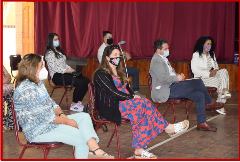
Ceremonia de Premiación

En una sobria, pero significativa ceremonia realizada en dependencias del Liceo de Cultura y Difusión Artística de Talca, el día miércoles 2 de diciembre, se premió a los alumnos que resultaron ganadores en el Concurso “English Meme Contest 2020”, organizados por la Red de Profesores de Inglés de la Comuna de Talca.