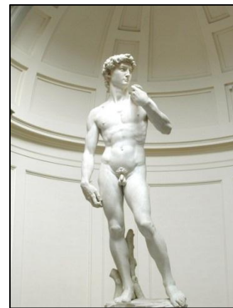
El David, de Miguel Ángel

La mayor impresión y circulación de libros sirvió para la transmisión de las ideas. Ejemplos de ello, son libros tales como La Utopía , de Tomás Moro y El Príncipe , de Maquiavelo que generaron discusiones en los círculos intelectuales y políticos de la época. También, los escritos de Galileo, Bruno y Servet, provocaron serios problemas a sus autores por la difusión que alcanzaron y el nivel de discusión que se generó frente a ellos.